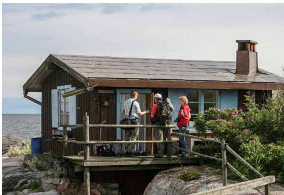
Kamera-67 besökte Klovharun senast i juli 2007.

Preliminärt räknar vi med avfärd från småbåtshamnen Sturjon. Vi försöker klara transporterna med egna mindre båtar, vilket förutsätter att det inte blåser för hårt. Minst en halv dag får man nog räkna med att utfärden tar.